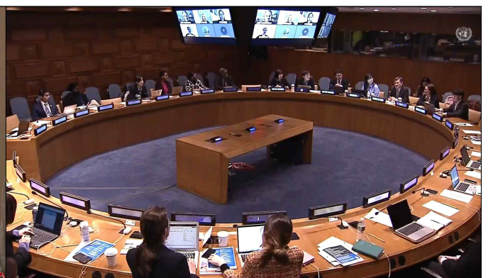
UN사회개발위원회 사이드이벤트 개최