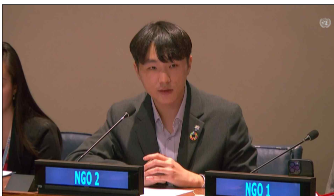
UN사회개발위원회 본회의의 구두성명문 발표